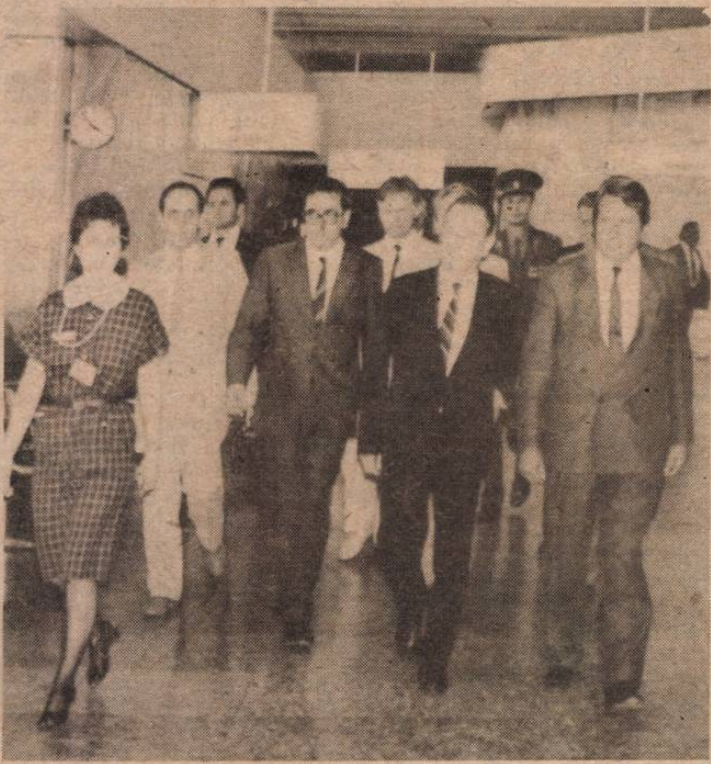
Grósz Károly, az MSZMP főtitkára, a Minisztertanács elnöke július 4-én Moszkvába utazott